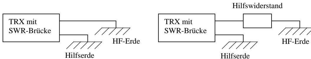
Abb. 2: Aufbau zum Messen des Erdwiderstandes ohne und mit Hilfswiderstand.

Am Ausgang des SWR-Meters wird der Innenleiter an die zu messende HF-Erde und der Außenleiter über eine kurze Leitung an die Hilfserde angeschlossen und das SWR auf der Betriebsfrequenz gemessen. Da wir ja alles dafür getan haben um eine möglichst niederohmige Erde zu bekommen, wird das SWR-Meter erwartungsgemäß einen sehr hohen Wert zeigen, wissen wir doch aus obiger Tabelle, dass ein \text{SWR} = 10 einem Erdwiderstand von 5 \Omega entspricht. Eine genauere Anzeige bekommen wir durch einen kleinen Trick. Wir fügen in die Leitung einen zusätzlichen 50 \Omega Hilfswiderstand ein. Damit haben wir bei einem angenommenen Erdwiderstand von 5 \Omega jetzt 55 \Omega welcher zu einem SWR von 1,1 führt, welches wesentlich genauer abzulesen ist.