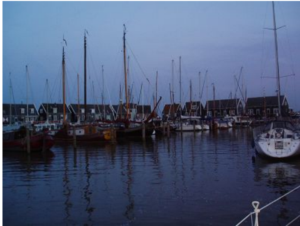
Abendstimmung im Hafen von Marken

Wir sind bereits das achte Mal mit dem Boot in Amsterdam. Für uns ist diese Stadt immer wieder faszinierend und wir kommen gern her. Wenn ich irgendwo wegen schlechten Wetters festliegen müsste, dann am liebsten hier. Dieses Mal haben wir herrliches Sommerwetter. Wir bleiben trotzdem für drei Tage.