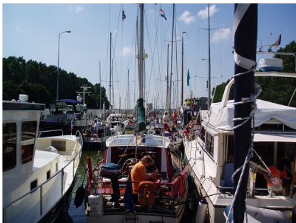
Lemster Week Stimmung in der Prinses-Margriet-Sluis

„Veränderlich 2 Bft und Sonne“ meint die Coastguard im morgendlichen Seewetterbericht. Wir wissen schon, dass das immer absolute Flaute bedeutet und sind uns sofort einig heute noch in Lemmer zu bleiben, uns erst einmal in Ruhe zu proviantieren und unsere MERGER gründlich zu waschen. In der Innenstadt ist viel Volk unterwegs und schon am Vormittag