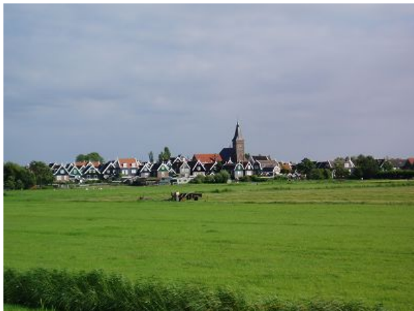
Für Segler eine eher ungewöhnliche Perspektive. Das Dorf Marken von der Landseite her fotografiert.

Wir fahren auf Marken zu und suchen danach das ausgebaggerte Fahrwasser, das uns in den Hafen bringen soll. Auf Marken waren wir noch nie und deswegen wollen wir unbedingt einmal hin, bevor wir im nächsten Jahr das IJsselmeer verlassen. Der Hafen ist verhältnismäßig klein, liegt weit von den üblichen Routen ab und ist oft bis auf den letzten Platz belegt. Diesmal haben wir Glück und finden gleich nach der Einfahrt an Steuerbord an der Mauer ein für uns passendes Plätzchen. Die Stelle wirkt zunächst etwas unruhig, was sich aber schon bald ändert. Bereits am frühen Abend, wenn der letzte Touristendampfer die Tagesgäste nach Volendam zurückgekartt hat, gehört die Insel den Einheimischen und wenigen Übernachtungsgästen. Wir genießen die Ruhe und schauen der Dorfjugend zu, die jetzt vor und in der Hafeneinfahrt schwimmen geht.