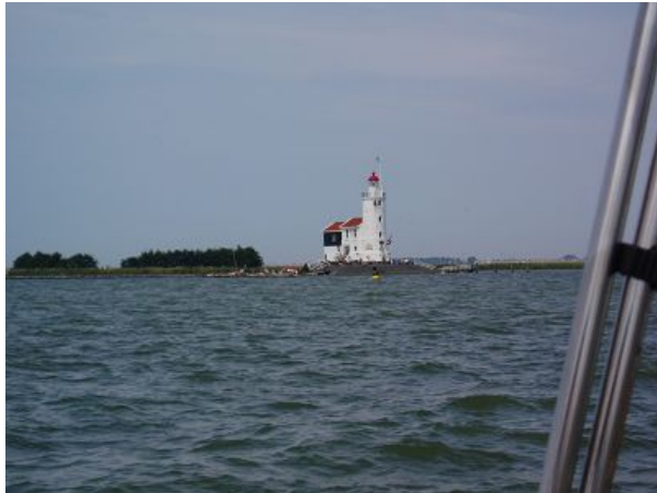
„Das Pferd von Marken“ wird dieser markante Leuchtturm genannt. Man kann einfach nicht vorbei fahren ohne ihn zu fotografieren.

12.40 Uhr haben wir den markanten Leuchtturm von Marken querab. Danach geht dem Wind mehr und mehr die Puste aus. Um 13.15 Uhr machen wir nur noch 2 kn Fahrt und mit dem