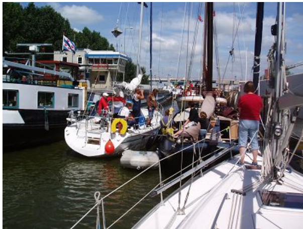
Entgegen ersten Befürchtungen ist in der Prinses-Margriet-Sluis für uns alle Platz.

In der Nacht hat es geregnet und auch als wir um 9.00 Uhr aufbrechen ist alles grau in grau. Wir haben WS 4-5 und es weht genau von achtern. Der Wind soll weiter zunehmen, so dass der Spinnaker nicht in Frage kommt. Nur unter Vorsegel machen wir uns auf in Richtung Lemmer. Schon nach kurzer Zeit kommt der nächste kurze aber heftige Schauer. Für wetterfeste Kleidung war es uns vorher zu warm und jetzt geht alles viel zu schnell um noch zu wechseln. Wir sind nass bis auf die Knochen. Danach nehmen Wind und Seegang weiter