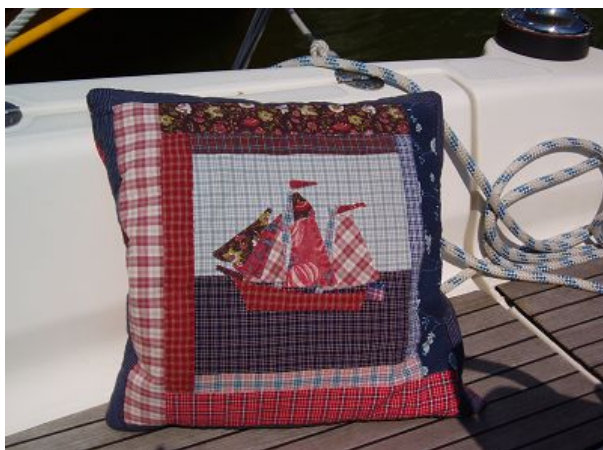
Ein Kissen mit Segelmotiv ergibt während des Schleusens sofort ein Gesprächsthema mit dem netten Nachbarlieger.

stehen die Leute mit Biergläsern vor den Kneipen. Warum das so ist, wird uns schnell klar. Es ist Lemster Week und die ganze Woche wird gefeiert. Höhepunkt ist das Skutsjesilen http://www.skutsjesilen.nl/2008/ bei dem über den Juli verteilt an verschiedenen Orten in Friesland Regatten traditioneller friesischer Boote stattfinden. Diese Woche finden die Wettkämpfe in Lemmer statt. Damit ist Ausnahmezustand und jeder echte Friese ist auf den Beinen um wenigstens als Zuschauer dabei zu sein. Die Stimmung kann man schlecht beschreiben, man muss es erlebt haben. Die Fußballeuropameisterschaft vor kurzem war jedenfalls nichts dagegen.