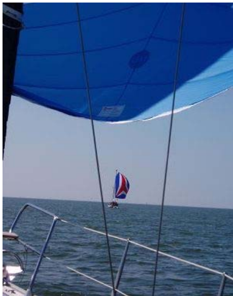
Nach dem wir unseren Parasailor gesetzt haben, wird der Abstand zum Spinnaker vor uns immer kleiner.

In der Schleuse liegen wir längsseits einer wunderschönen traditionellen Lemsteraak. Während ich das Schiff bewundere fallen meiner Frau zwei besonders schöne Patchworkkissen mit Schiffsmotiven auf. Aus ihrer Frage, ob sie die fotografieren dürfe, ergibt sich eine nette Schleusenbekanntschaft und als die Schleuse für uns öffnet steckt die Nachbarin ihr sogar einen Zettel mit der Adresse des Geschäftes in Amsterdam zu, bei dem es diese Stoffe gibt.