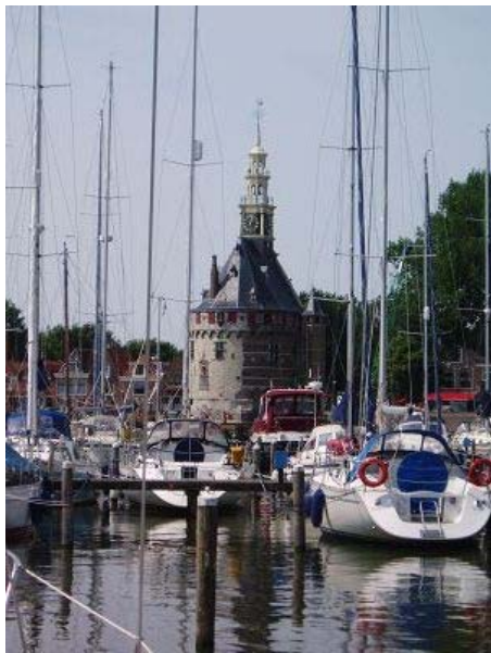
Ein traumhafter Liegeplatz direkt vor der Kulisse der alten Stadt Hoorn.

Auf dem zweiten Blick bemerkt man auch, dass Marken nicht nur ein Ort für Touristen ist. Es scheinen auch eine ganze Reihe Leute hier zu wohnen, die zur Arbeit in die umliegenden Orte bis nach Amsterdam pendeln. Am zentralen Busbahnhof gibt es demzufolge auch einen recht akzeptablen Supermarkt in dem man sich gut versorgen kann. Wir nutzen die Gelegenheit und wandern in einer guten halben Stunde zum markanten Leuchtturm hinaus um diesen endlich einmal von Land aus der Nähe zu betrachten. Es ist eine wunderschöne Strecke, die mitten durch die Wiesen und ein Vogelschutzgebiet führt. Vor Ort sind wir aber enttäuscht. Das Gebäude wird durch einen Privatmann bewohnt und ist durch ein massives Gitter dem Besucher versperrt. Trotzdem bereuen wir nicht den Weg gemacht zu haben, entdecken wir doch am Wegesrand unzählige uns meist unbekannte Vögel und einen Bullen, der noch gemeinsam mit seinen Kühen auf die Weide darf sowie manch anderes Kleinod. Zum Abschluss kaufen wir am Hafen noch eine Tüte Pommes Frites und sind überrascht, so gute haben wir schon lange nicht mehr gegessen.