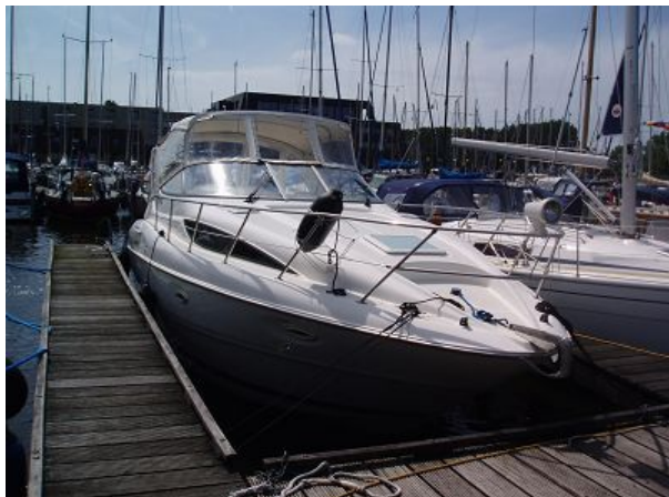
Ein Schreck zum Abschluss. Auf unserem Liegeplatz liegt ein fremdes Motorboot.

zu. Es dauert nicht lange und wir haben 1,5 m Welle bei 6 Bft. Das Vorsegel zur Hälfte gerefft machen wir immer noch zwischen 6 und 7 kn Fahrt. Noch vor 12 Uhr stehen wir vor der Schleuse, die vor unseren Augen zumacht. Vermutlich hätte man uns sowieso nicht mitgenommen, da bereits andere Boote am Wartesteiger liegen. Na gut, dann leisten wir diesen eben Gesellschaft.