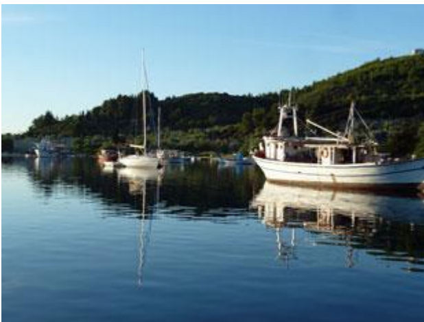
Im Morgenlicht zeigt sich die ganze Idylle von Gialtron.