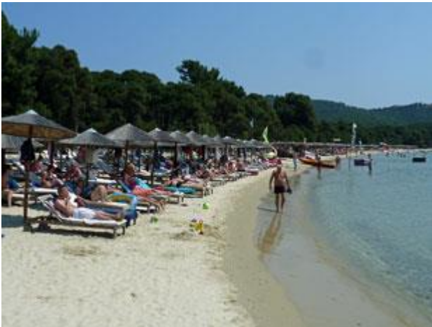
Die zwei Gesichter von Koukounaries: Tagsüber Trubel

Abends, nachdem das letzte Ausflugsschiff wieder weg ist, hat der Strand seine Ruhe wieder. Unsere Nachtruhe wird lediglich durch ein Motorboot, dessen Skipper meinte mit vollem Speed durch das kleine Ankerfeld der Segler brettern zu müssen, gestört. Nun, es hätte schlimmer kommen können. Der Vollmond entschädigt für Vieles.