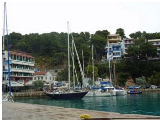
Am Anleger für Sportboote ist es manchmal ganz schön schwellig.