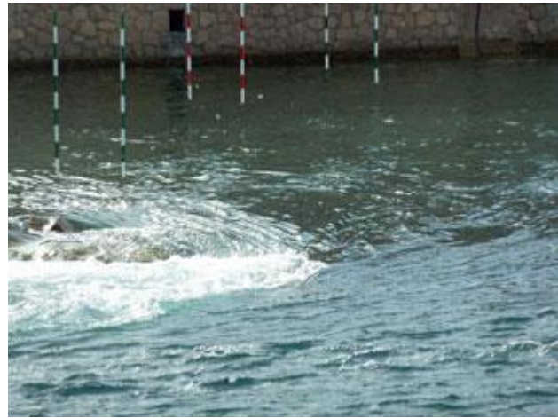
An einer besonders strömungsstarken Stelle ist sogar ein Wildwasserparcours aufgebaut.

Obwohl die Dienststelle der Polizei durchgehend geöffnet ist, werden Anmeldungen erst ab 16 Uhr entgegengenommen. Wir bezahlen 18,77 € Durchfahrtsgebühr -nein, Wechselgeld hat man nicht- und erfahren, dass wir ab 21 Uhr auf Kanal 12 Standby sein sollen. Dort wird man uns zweimal rufen, einmal damit wir uns für die Passage bereit machen können und ein zweites Mal, etwa 10 Minuten später, wenn die Brücke geöffnet und zur Durchfahrt bereit ist. Erst dann sollen wir ablegen.