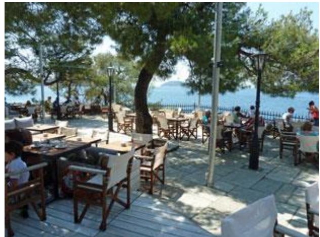
Im Café dort kann man herrlich entspannen und die Aussicht genießen.