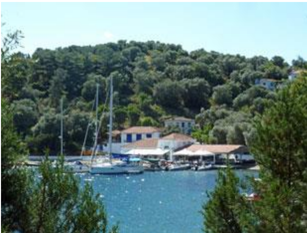
Auf Palio Trikeri liegen wir am privaten Steg eines Restaurants.

Die kleine Insel Palio Trikeri ist heute unser Ziel. Es gibt dort nur ein winziges Dorf mit vielleicht einem Dutzend Häuser. Die wenigen Anlegemöglichkeiten im Hafen sind schnell erschöpft. Als wir kommen, liegen bereits zwei Briten an beiden Seiten des Stegs vor dem Restaurant. Wir werden dazu gewunken und legen uns vor Buganker an den Kopf in die Mitte. Der Platz ist eine gute Entscheidung, wie wir schnell feststellen. Der Wirt bietet uns ungefragt an, von ihm Strom und Wasser zu beziehen und selbstverständlich dürfen wir uns auch in sein WiFi einloggen. Logisch, dass wir bei so viel Freundlichkeit später bei ihm zu Abend essen.