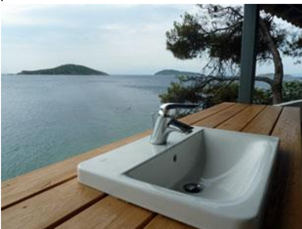
Die öffentliche Toilette auf Bourtzi hat den schönsten „Toilettenblick“, den wir kennen ...