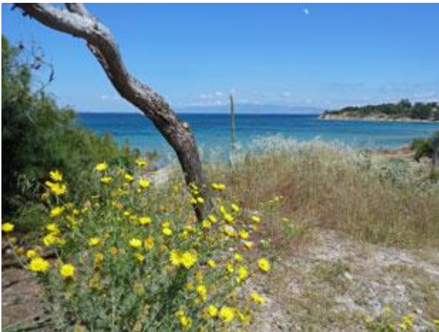
Nur wenig außerhalb des Ortes findet man auf Aegina eine wunderbare Badebucht in wilder Natur.

Jetzt in der Woche gibt es im Hafen sogar freie Plätze. Die nahen Charterbasen in Reichweite des Flughafens am Festland lassen die Masse der Boote nur am Wochenende eintrudeln. Charterboote haben eine deutlich geringere Liegegebühr, wobei sich auch die für uns Eigner sehr in Grenzen hält. Wie immer in Griechenland ist das Berechnen ein komplizierter Vorgang, der einige Zeit in Anspruch nimmt. Für unser Boot kommt am Ende ca. 5 €/Tag heraus, nur der erste Tag ist etwa 50% teurer.