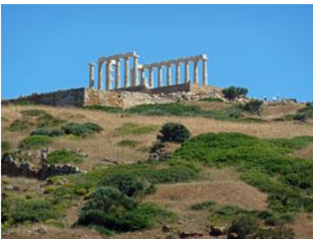
Der Poseidon-Tempel auf Kap Sounion ist schon von weitem zu sehen. Herangezoomt werden auch Einzelheiten sichtbar.