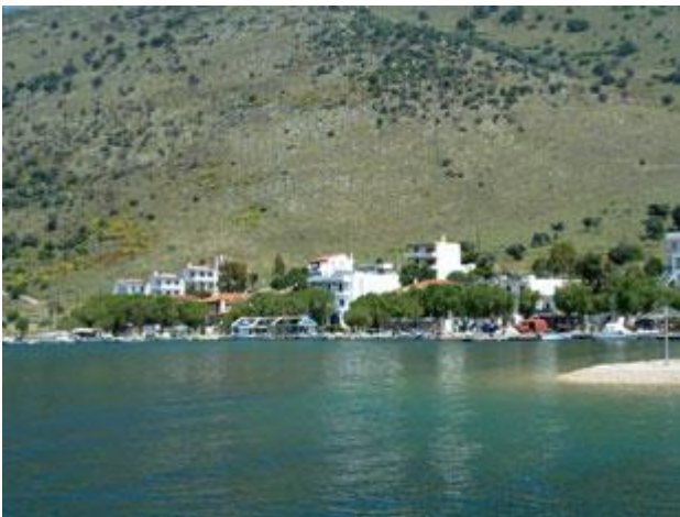
In der Ormus Voufalou liegt man absolut geschützt hinter einer Sandbank.

Immer wieder gibt es kleine Inselchen denen wir ausweichen müssen. Gegen 14 Uhr kommt sogar ein für uns idealer Südwind auf, der sich später zu einem satten Vierer auswächst. Das Segelvergnügen ist aber nur kurz. Um 15.30 Uhr fällt in der Ormus Voufalou (Bufalu) auf 5,5 m Tiefe unser Anker. Hier liegen wir in idyllischer Lage absolut geschützt hinter einer Sandbank. Nur ein zugängliches Internet gibt es nicht und auch der Mobilfunk ist extrem schwach. Heute sind wir wieder einmal für die KW dankbar. Auf die Freunde von Intermar ist Verlass.