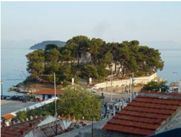
Die kleine über einen Damm verbundene Insel Bourtzi ist unser Lieblingsplatz auf Skiathos

Internet haben wir von einem Café etwa 200 m auf der gegenüberliegenden Straßenseite. Übersehen habe ich leider, dass längs der Straße ein Parkplatz für Busse eingerichtet ist. Die WiFi-Verbindung klappt wunderbar wenn, ja wenn da kein Bus steht.