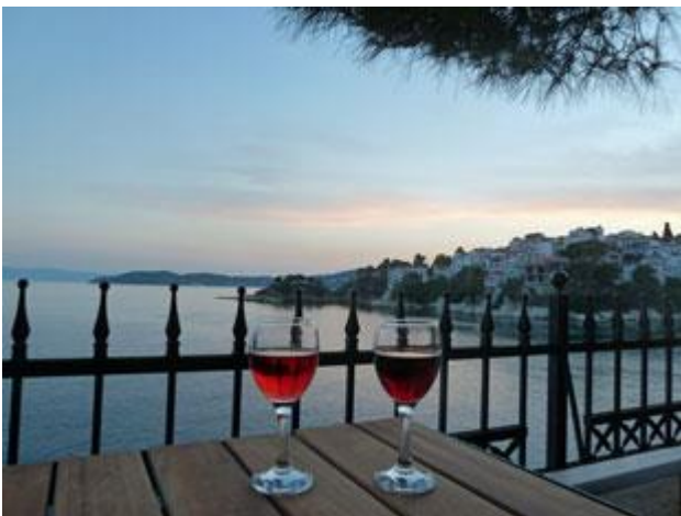
So lässt es sich leben: Abendstimmung auf dem Inselchen Bourtzi Skiathos

Es gibt unzählige Gaststätten in Skiathos. Alle leben von Touristen, die meisten sind demnach auch auf einfache Abfütterung für anspruchslose Konsumenten eingerichtet. Heute bekamen wir den Tipp für „La Cucina di Maria“, der es verdient weitergegeben zu werden. Normalerweise kämen wir nie auf die Idee in Griechenland italienisch zu essen aber dieser Ort unter einem Maulbeerbaum hat etwas Magisches. Alles wird frisch zubereitet, und selbst so einfache Dinge wie Knoblauchbrot (Teigtasche mit Käsefüllung und gehacktem Knoblauch) sind ein Gedicht!