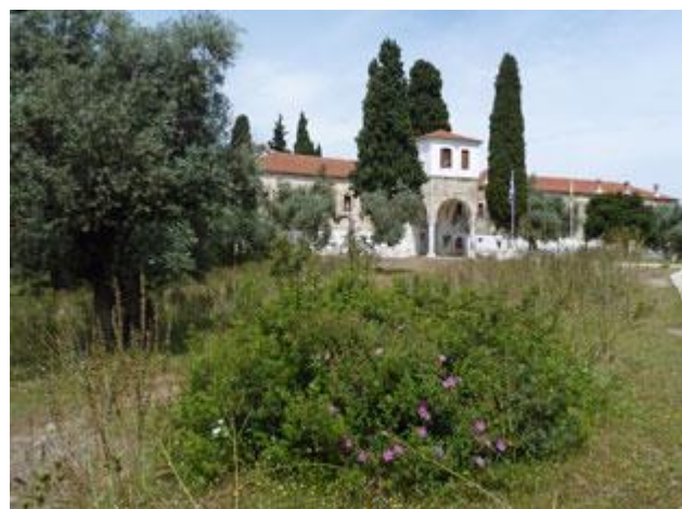
Im überraschend großen Kloster lebt heute nur noch ein einzelner Mönch.

Heute am Sonntag ist einiges los. Immer wieder kommen zwei Taxiboote, die Besucher bringen oder wieder abholen. Neben privaten Booten scheint dies die einzige Möglichkeit sein auf die Insel zu kommen. Am Nachmittag kommt, entgegen allen Vorhersagen, Wind auf. Vor der Bucht zeigen sich sogar Schaumkronen. Dabei handelt sich aber wohl um eine lokale Erscheinung. Als die