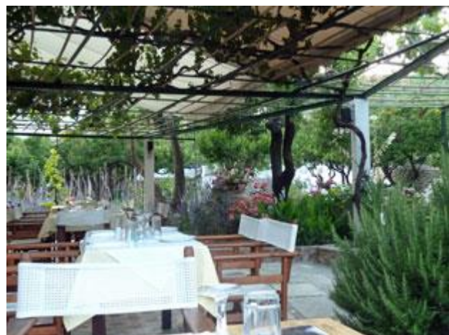
Das Restaurant Pervoli in Skopelos ist eines der wenigen, die wir guten Gewissens weiterempfehlen können.