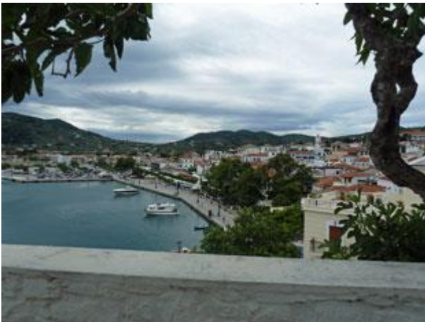
Der Hafen von Skopelos ist sehr groß.

Wie immer in den letzten Tagen mangelt es auch heute an Wind. Wenn nicht für die kommende Nacht für ein paar Stunden West mit bis zu 25 kn angekündigt wäre, würden wir hier bleiben. Da Agnontas nach Westen offen ist, ziehen wir es vor, uns 2 h weiter in die Inselhauptstadt Skopelos zu verlegen. Eine gute Entscheidung stellen wir fest. Ein Ort der keine Wünsche offen lässt, aber doch eine gewisse Ruhe ausstrahlt und sich damit wohltuend von dem doch etwas hektischen Skiathos abhebt. Im Hafen gibt es reichlich Platz und auch Wasser und Strom, wenn man am Kiosk eine Guthabenkarte erwirbt.