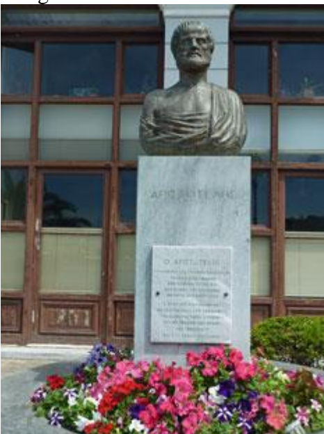
Der Philosoph Aristoteles soll sich aus Verzweiflung, weil er nicht hinter das Phänomen der Strömungen kam, in die Fluten gestürzt haben und darin umgekommen sein.

Obwohl die Dienststelle der Polizei durchgehend geöffnet ist, werden Anmeldungen erst ab 16 Uhr entgegengenommen. Wir bezahlen 18,77 € Durchfahrtsgebühr -nein, Wechselgeld hat man nicht- und erfahren, dass wir ab 21 Uhr auf Kanal 12 Standby sein sollen. Dort wird man uns zweimal rufen, einmal damit wir uns für die Passage bereit machen können und ein zweites Mal, etwa 10 Minuten später, wenn die Brücke geöffnet und zur Durchfahrt bereit ist. Erst dann sollen wir ablegen.