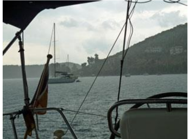
Nach dem Wind kommt der Regen, es gießt wie aus Kübeln in der Ormus Vathoudi.