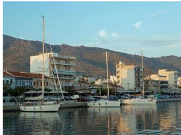
Im großen Hafen gibt es viel Platz.