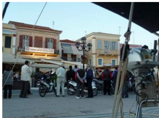
Am nächsten Sonntag wird ein neuer Bürgermeister gewählt. Der Wahlkampf findet direkt vor unserem Liegeplatz statt.