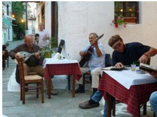
Musikanten unterhalten die Gäste mit griechischer Volksmusik.

Bei unserer Ankunft in Skiathos sorgen heute wir für Hafenkino. Zunächst legen wir ganz normal vor Buganker an um dann festzustellen, dass es wohl doch Muringleinen gibt. Zumindest haben einige Boote damit festgemacht und auch an unserem Platz finden wir eine. Da außerdem der Anker nicht ganz optimal platziert ist, entschlief ich mich wieder rauszufahren und die Muring zu benutzen. Beim Festmachen entdecken wir dann, dass es sich lediglich um einen alten Rest handelt der vorne keine Befestigung mehr hat. Also wieder raus und doch den Anker nehmen, der diesmal nicht fasst und zu allem Unglück auch noch eine andere Kette reißt. Erst beim vierten Mal verläuft