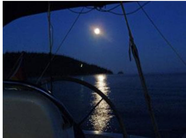
und am Abend himmlische Ruhe.