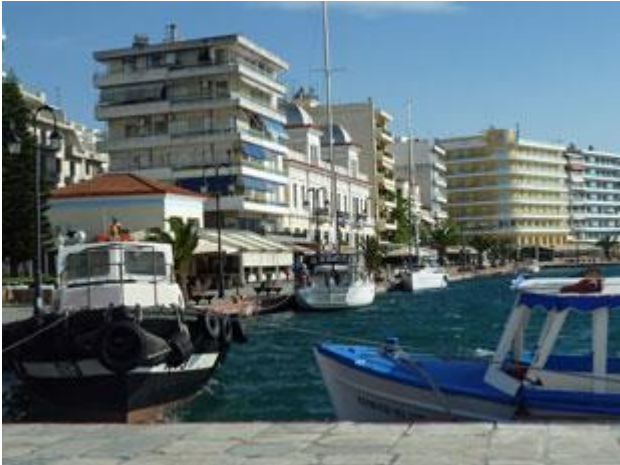
Im Wartebereich auf der Nordseite der Brücke liegt man mitten in der Stadt.

ein weiteres Boot ab und ziehen vor der Brücke ihre Kreise. Erst eine viertel Stunde später öffnet sie dann wirklich. Prompt kommt von einem der Wartenden die Anfrage ob man jetzt passieren dürfe. Da die im Fahrwasser motorenden Boote wohl ein Hindernis darstellen würden, wird die Erlaubnis erteilt obgleich ja vorgesehen war, erst die andere Seite passieren zu lassen. Dies ist auch für uns das Zeichen abzulegen und als letztes, der vier Boote passieren auch wir.