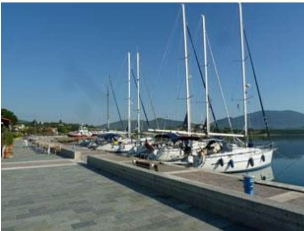
Entgegen den Informationen aus unserem Hafenfürher finden wir in Achillion moderne Anlagen vor.

Die beiden Taxiboote fahren emsig zwischen dem Inselhafen und einer uns unbekanntem anderen Stelle hin und her. Sie bringen nicht nur mit Einkaufstaschen schwerbepackte Inselbewohner, Schulkinder und viele neue Tagesgäste sondern auch Waren bis hin zu Zementsäcken. Bei dem Tempo mit dem sie unterwegs sind, müssen sie einen enormen Treibstoffverbrauch haben. Wie sich das alles rechnet, ist uns ein Rätsel.