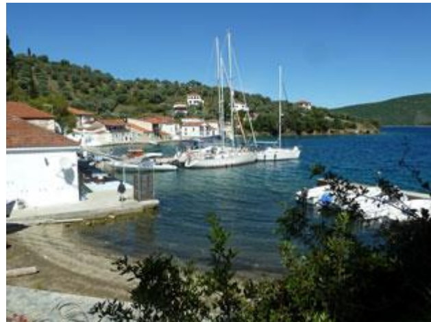
Die Bucht ist gut geschützt. Nur am Nachmittag kommt regelmäßig ein lokaler Wind auf.