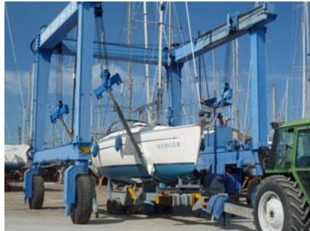
Die Werftarbeiter polsterten extra die Krangurte, damit das Boot keine Kratzer bekam.