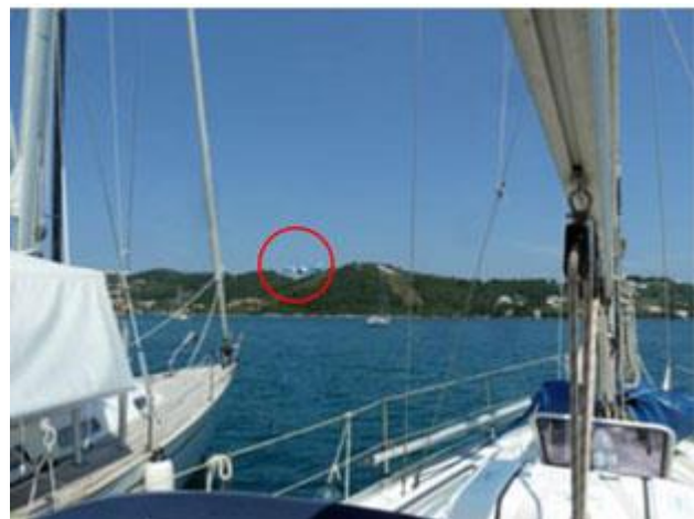
Der Hafen liegt in einer geschützten Naturbucht über die auch die Flugzeuge einfliegen.