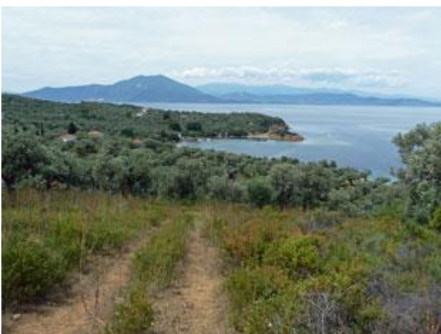
Das Inselinnere ist einsam und von weiten Olivengärten geprägt.