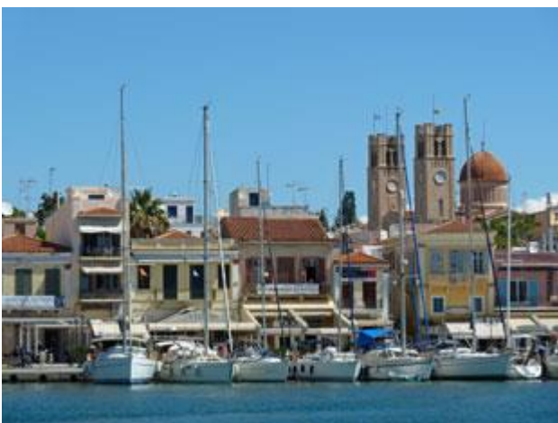
Im Hafen von Aegina liegen wir direkt an der Promenade mitten in der Stadt. Um uns herum brodelt das pralle Leben.

Gleich morgens stelle ich fest, dass die Sicherung für das 12 V-Bordspannungsladegerät unseres Laptops defekt ist. Ersatz für ein solch exotisches Teil habe ich natürlich nicht. Ein netter Fernsehändler im Ort beginnt aber, als ich ihm mein Problem erkläre, sofort mit der Suche in seiner Werkstatt und wird auch tatsächlich fündig. Kaum eingebaut ist die neue Sicherung sofort wieder kaputt, was auf einen größeren Schaden schließen lässt. Ein neues Ladegerät hat er natürlich nicht vorrätig, geht aber sofort zum Telefon. Nach ein paar Gesprächen teilt er mir freudestrahlend mit, dass er bis Montag eines bekommen könne. Kein Problem für uns, wir hatten sowieso vor noch über das Wochenende zu bleiben.