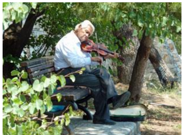
... und außerdem leise klassische Livemusik aus dem Hintergrund.