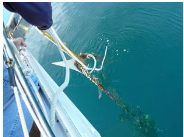
Unser Anker hat sich in der schweren Kette eines Fischkutters verfangen.

Mangels Wind findet die Fahrt heute wieder unter Motor statt. Teilweise erinnert uns die Landschaft an einen norwegischen Fjord. Gegen 13 Uhr laufen wir in Oreoi ein und liegen mit zwei anderen Yachten längsseits an der nördlichen Mauer. Der Ort macht nicht viel her, hat aber einen soliden Hafen und es gibt Wasser und Strom.