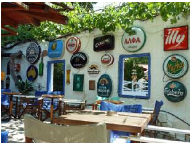
Überall gibt es Restaurants, die auf Gäste hoffen.