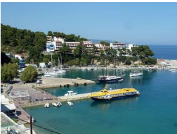
Der Hafen von Patitirion auf Alonnisos ist ein nach Süden weitgehend offene Bucht.

Erstmalig seit Aegina müssen wir im Hafenbüro vorsprechen. Nach sorgfältigen Prüfen unserer Papiere werden für die nächsten 4 Tage 15,80 € Gebühren fällig. Es gibt kostenloses (leicht salziges) Wasser aber keinen Strom, dafür aber schnelles Internet vom Hotel auf der anderen Straßenseite.