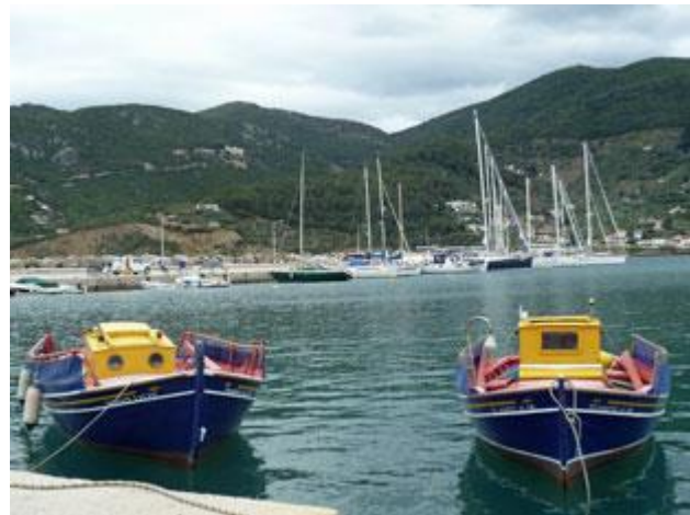
Die wenigen Sportboote verlieren sich fast.