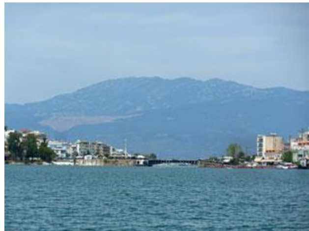
Ansteuerung auf die Brücke von Chalkis. Die rote Mauer an Steuerbord ist der Wartebereich für Sportboote.