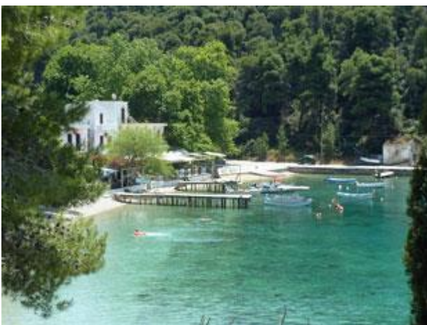
Glasklares Wasser lädt in der Ormus Agnontas zum Baden ein.

Die ruhige Großwetterlage hält immer noch an. Draußen können wir eine halbe Stunde segeln, dann machen wir wieder nur noch einen Knoten Fahrt. Erst kurz vor unserem Ziel, der Ormus Agnontas auf der Insel Skopelos, zeigen sich am Kap Myti Schaumkrönchen und es beginnt uns mit 3 Bft entgegen zu blasen. Die Bucht selbst ist ein Traum. Laut Handbuch hatten wir eher eine Ankermöglichkeit erwartet, können aber mit zwei anderen Booten längsseits am etwas maroden Kai festmachen. Der wird nur gebraucht, wenn die Fähre wegen des Wetters Skopelos nicht anlaufen kann. Derzeit sieht das aber nicht so aus. Es gibt sogar Versorgungssäulen mit Wasser und Strom, für die man im Minimarkt eine Chipkarte erstehen kann. Hätten wir's gewusst, hätten wir hier unser Wasser sicherlich wesentlich einfacher und billiger bekommen. Und, um alldem noch ein Sahnehäubchen aufzusetzen, finde ich nach all dem Trouble auf Skiathos, gleich drei frei zugängliche Netze mit schnellem Internet.