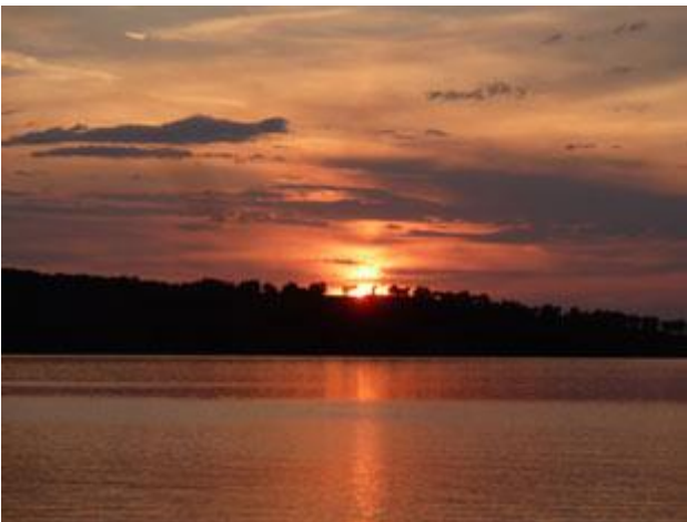
Nach dem ganzen Trouble verabschiedet sich der Tag mit einem besonders schönen Sonnenuntergang und ...