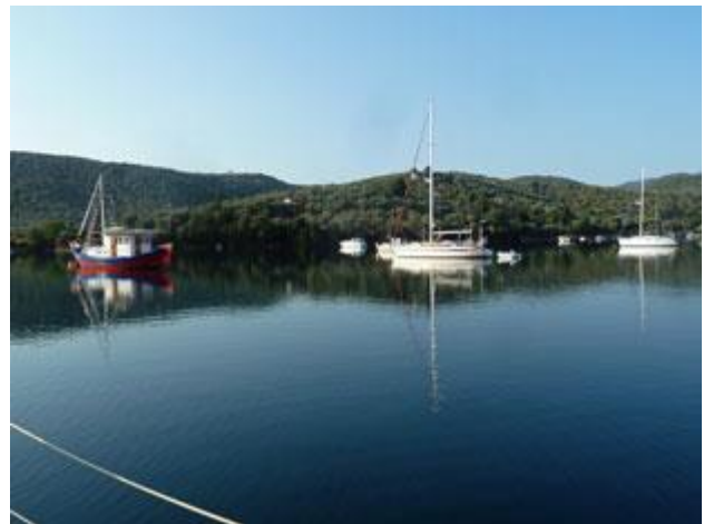
... am nächsten Morgen zeigt sich die ganze Schönheit der Bucht.

Wir haben es gerade noch rechtzeitig geschafft. Eine starke Böe nach der anderen fetzt über uns hinweg und über den Nachmittag kommt eine Reihe andere Boote, die es uns nachmachen. Gottseidank ist der Besitzer unserer Boje nicht dabei. Um 15 Uhr ist der Wind genauso plötzlich vorbei, wie er gekommen ist. Dafür beginnt es zu regnen, was sag ich regnen, es schüttet wie aus Kübeln Unmengen Wasser. Um uns herum ist alles schwarz und immer wieder zucken Blitze. Nur langsam zieht das Gewitter weiter. Erst am Abend hat sich alles wieder beruhigt und der Tag entschädigt uns mit einem besonders schönen Sonnenuntergang, der in keiner Weise erahnen lässt, was wir hier heute erlebt haben.