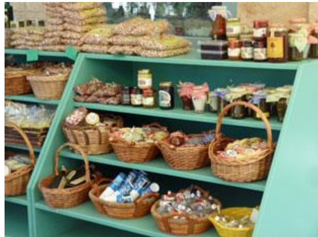
Pistazien sind die Spezialität der Insel Aegina. Sie werden überall pur oder zu Produkten veredelt angeboten.