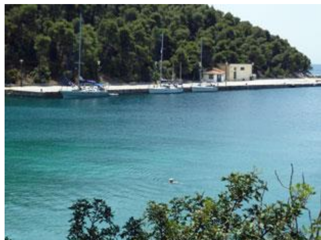
Am Kai ist viel Platz für Sportboote. Fährschiffe legen hier nur bei schlechtem Wetter, wenn Skopelos nicht angelaufen werden kann, an.