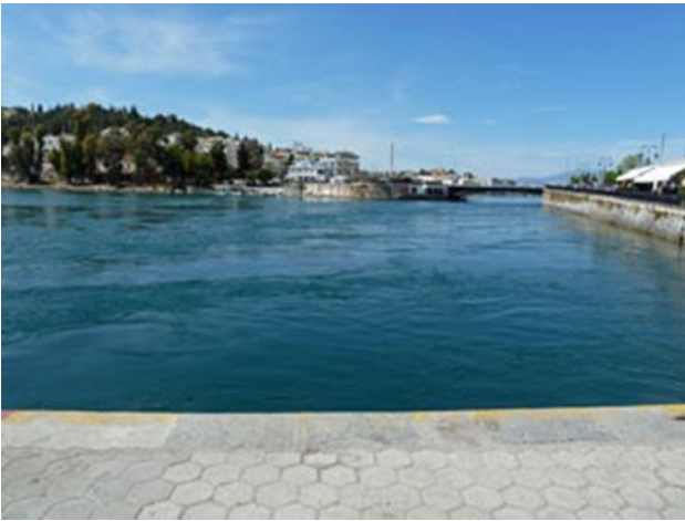
Die Tide erzeugt eine beträchtliche Strömung.

wie wir das erste Mal hier ist. Auf die Stadt zulaufend erkennen wir gerade noch rechtzeitig, dass es wohl ein Fehler wäre den Yachthafen an Steuerbord anzusteuern. Unmittelbar vor der Brücke gibt es einen auffällig rot markierten Bereich in dem Sportboote auf die Brückenöffnung warten dürfen. Ein Hafenzwischenmann empfängt uns, hilft beim Festmachen und informiert, wo wir in der Nähe das Büro finden, in dem wir uns für die Passage anmelden müssen. Am Warteplatz gibt es Wasser und Strom, wenn man bereit ist für 10 € eine Guthabekarte zu kaufen. Das Liegen selbst ist kostenlos.