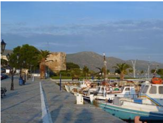
An Karystos im Süden der Insel Euböa ist der Tourismus bisher weitgehend vorbei gegangen.