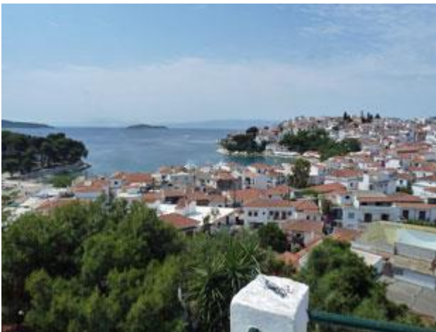
Skiathos, die Stadt auf der gleichnamigen Hauptinsel der Nördlichen Sporaden, ist sehr touristisch.

Für den 20. Juni buchen wir einen Flug vom 35 km entfernten Volos über Wien nach Düsseldorf und haben jetzt 4 Wochen Zeit, die wir in den Sporaden verbummeln möchten. Ziel des heutigen Tages ist zunächst erst einmal das 25 sm entfernte Skiathos. Bei der seit Tagen andauernden Schönwetterlage, die sich laut Prognosen zunächst auch nicht ändern wird, haben wir nur wenig Wind. Erst als wir die Halbinsel Trikeri hinter uns lassen weht, zunächst von vorn dann aber zu unseren Gunsten drehend, ein schwaches Lüftchen. Kaum haben wir die Segel oben ist der Spaß auch schon wieder vorbei.