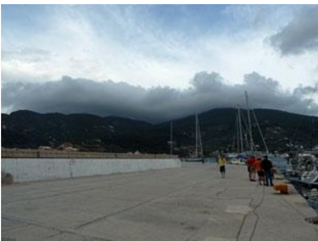
Die schnell heranziehende schwarze Wolke löst auf allen Booten hektische Betriebsamkeit aus.