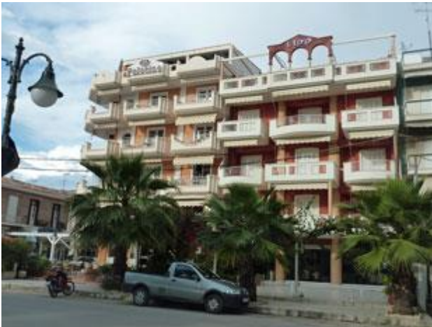
Prachtbauten vergangener Zeiten: Die meisten Hotels in Loutra Aidipsou sind geschlossen.

Am Morgen zeigt sich die ganze Idylle der Bucht. Am Ufer gibt es nur wenige Häuser aber viele Fischer- und auch Freizeitboote liegen hier wohl ständig vor Anker oder an Bojen. Wie sicher wir heute Nacht hier lagen zeigt sich, als wir unseren Anker heben wollen. Er hat sich in der ca. 20 mm Kette eines größeren Fischerbootes verfangen. Wir sind erstaunt, dass wir, zwar mit etwas Mühe, auch mit unserer verhältnismäßig kleinen Winde diese Kette heben können und kommen, mit den in solchen Fällen üblichen Seiltricks, ohne größere Probleme aus eigener Kraft frei.