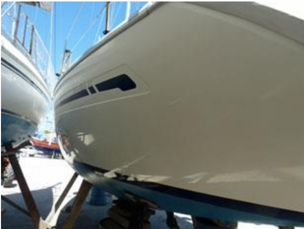
Nach Abschluss der Polierarbeiten glänzt unsere MERGER wieder wie in alten Zeiten.