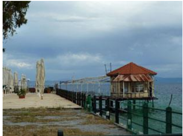
Viele Kureinrichtungen haben sicher schon bessere Zeiten gesehen.