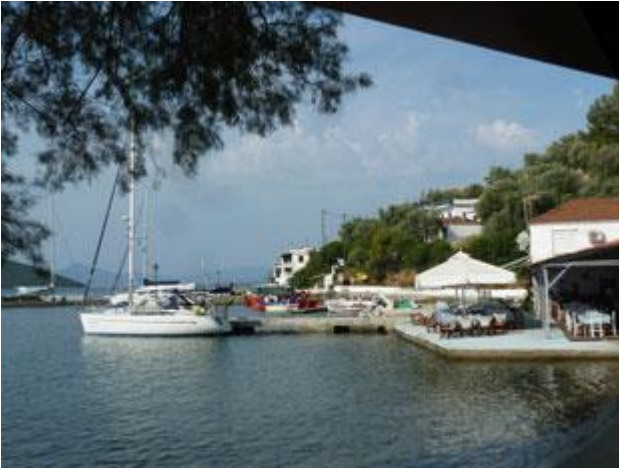
Paleo Trikeri ist einfach ein schönes Plätzchen, man kann gut zweimal hinfahren.

Wir können ihn jedenfalls nirgends ausmachen. In der Bucht, in der wir in vermuten, ist alles voller Bojen. Die Windböen werden immer häufiger und so legen wir kurzentschlossen an einer der vielen unbesetzten an. Sicher hätte man auch irgendwo dazwischen noch einen Platz zum Ankern gefunden, aber einen in einer Muring verhakten Anker ist nicht das, was wir jetzt wirklich brauchen können.